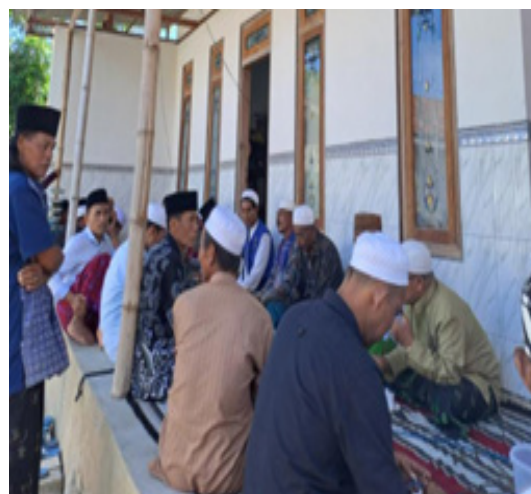
Gambar 1.2. Kelompok Breker sebagai Komunitas Pendengar Radio Zantrioz